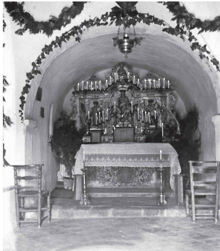
Interior de la capella de Santa Reparada amb el retaule barroc engalanat per a l'Aplec.