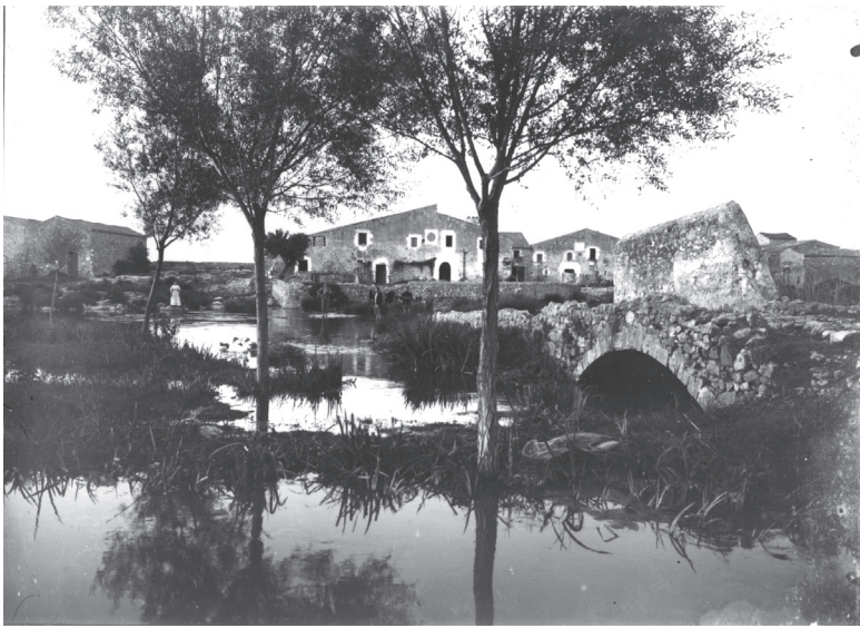
El mas Pere Quintana i Albornar, el mas Concas i el pont baixmedieval a l'entrada de Cinclaus. FOTO: JOSEP ESQUIROL, PRINCIPÍ DEL SEGLE XX, AHE